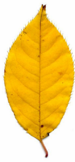
017サクラの仲間黄葉