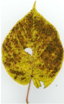
024ヒツバカエデ黄葉