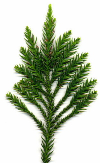
019スギ 1年中緑の葉っぱ