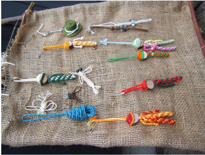
P23ロープワーク(組紐)