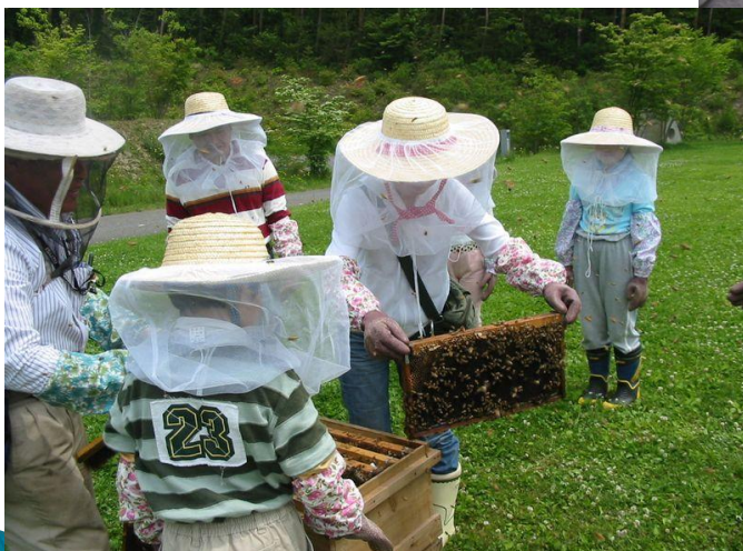
P4 はちみつ収穫体験