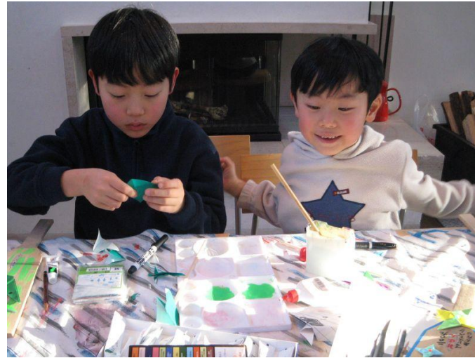
P24押し花の葉(しおり)作り