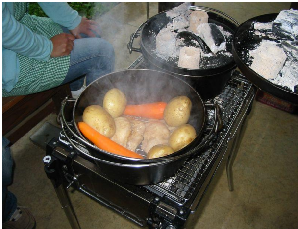
P1 ダッチオーブン料理教室