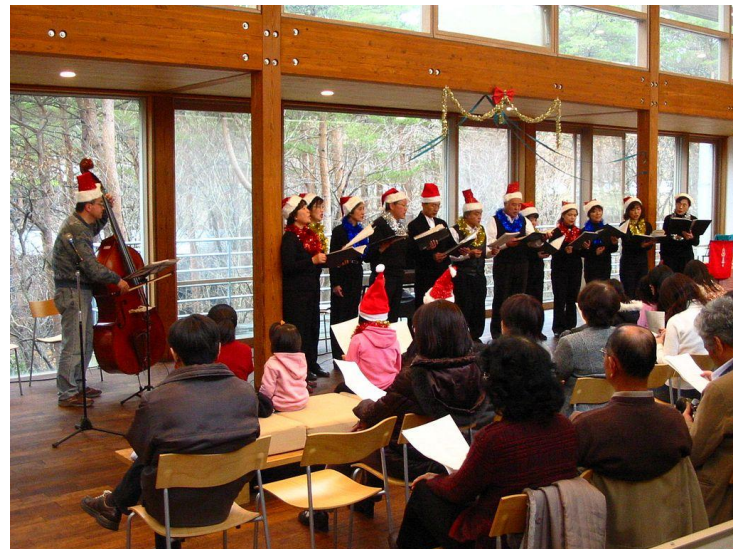
P26森のコンサート(クリスマス会)