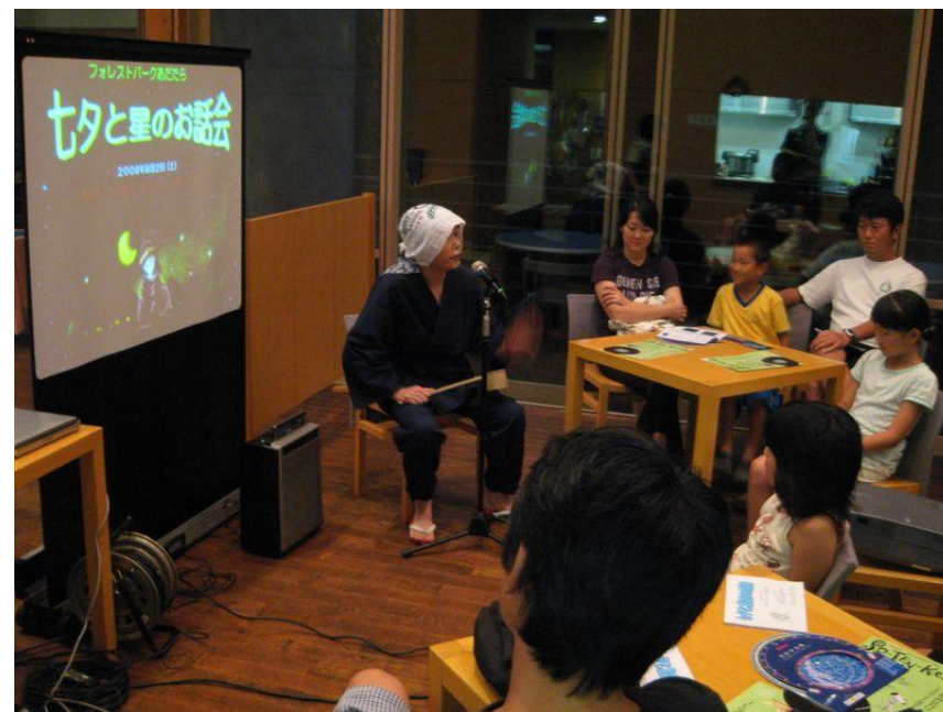
P22 七塔と星のお話し会