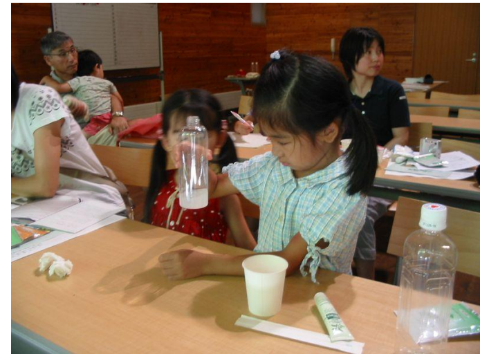
P16親子で学ぼう 石けんのふしぎ