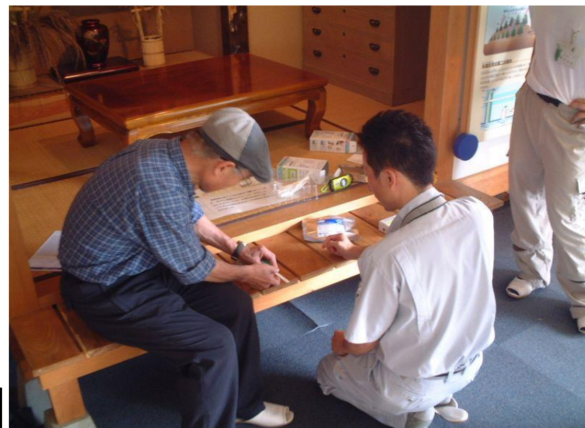
P8フォレストセラピー(効果測定)