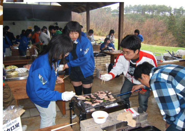
P5 野外バーベキュー(学校利用)