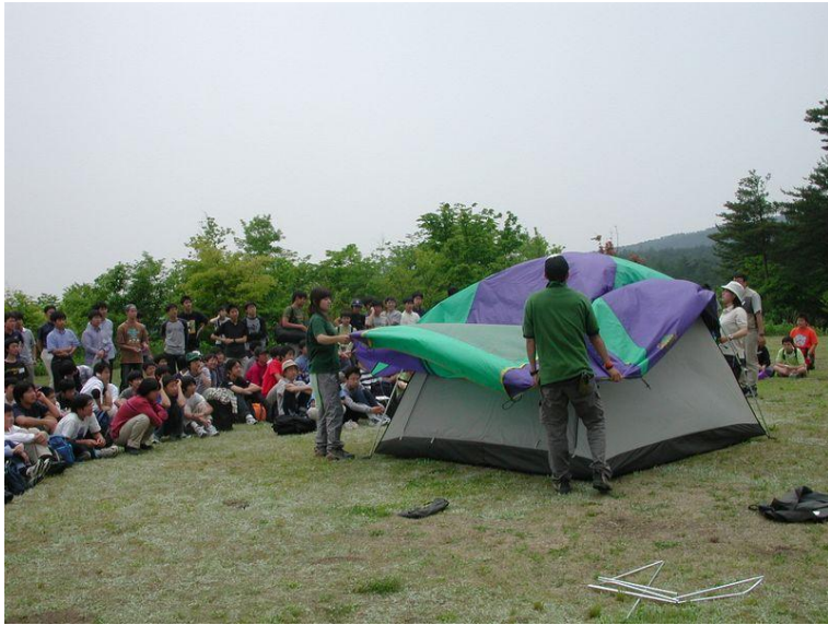
P31 野外生活体験(中学生)