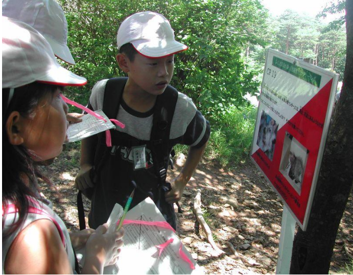
P13もりのクイズ(オリエンテーリング)