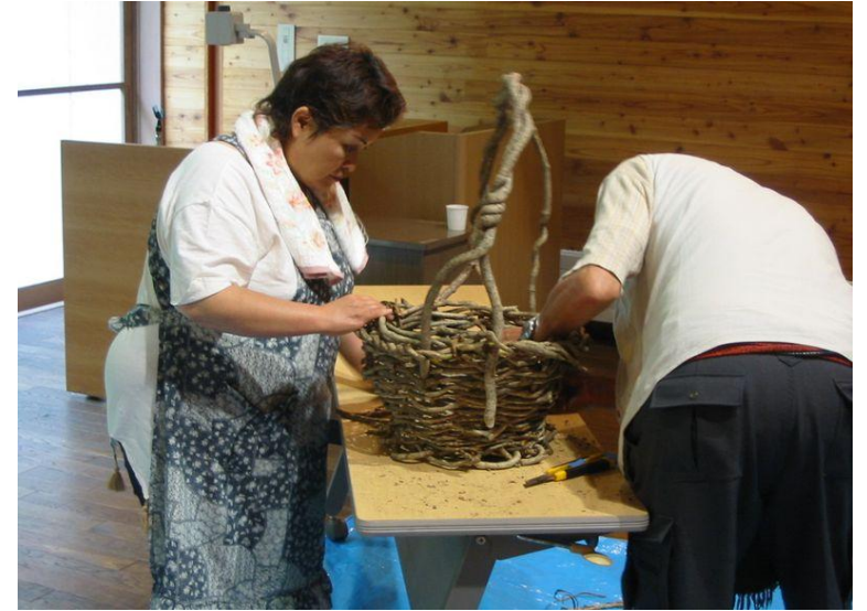
P18つるかご編み教室