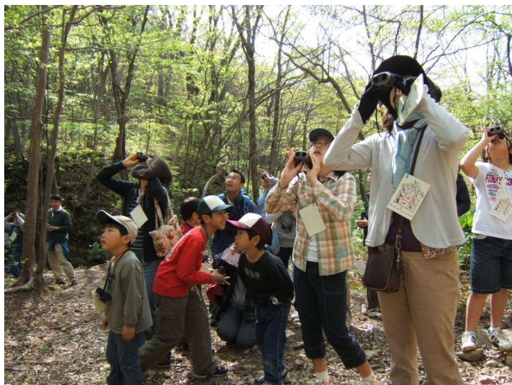
P9 バードウォッチング