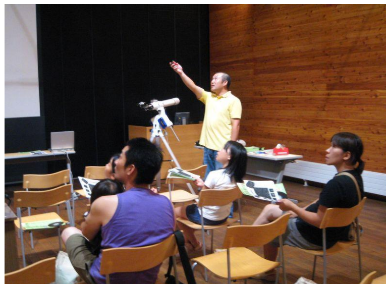
P11 星空観察会(室内レクチャー)