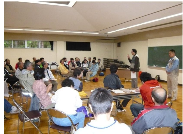
P34 環境学習指導者養成