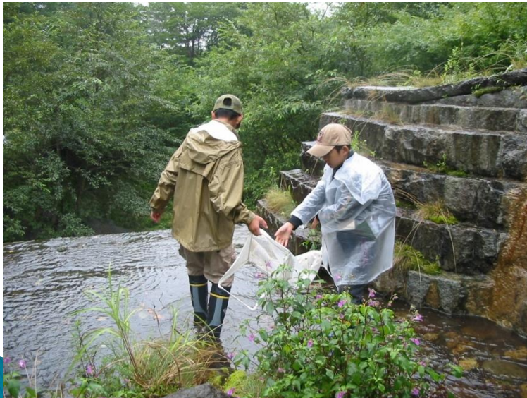
P33 あだたら生物クラブ