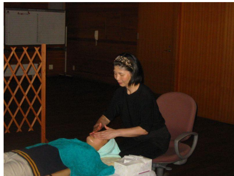
P6アロママッサージ