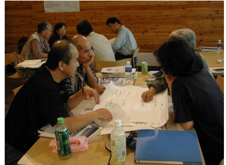
P32 もりの案内人養成