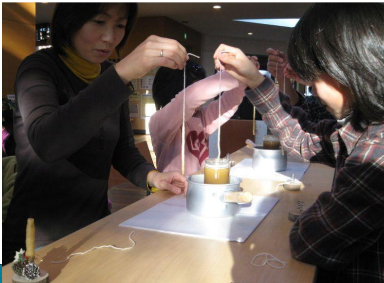
P19蜜蝋キャンドル作り